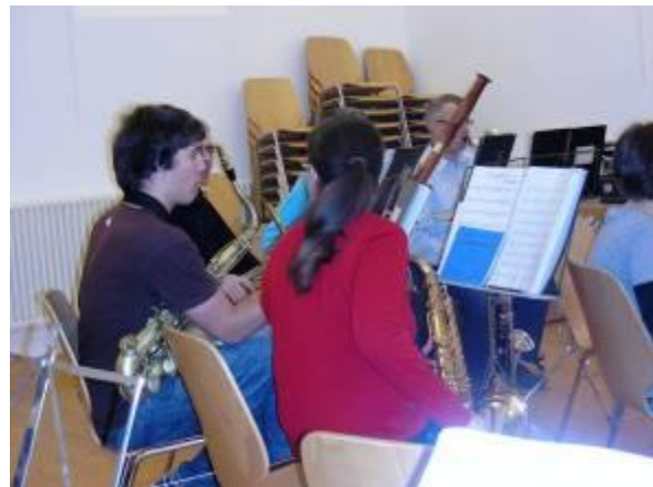
Üben, Üben und nochmals Üben